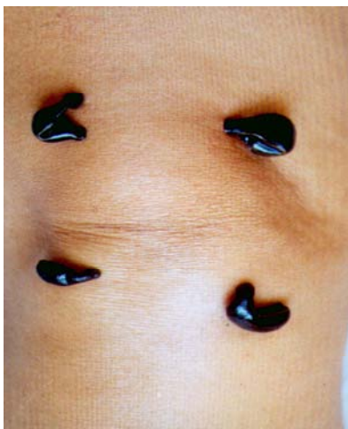
Abb. 2: Blutegel periartikulär am Knie